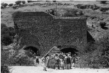
(Fig. 1) AÑO 1978

En primer lugar la destrucción en enero de 1980 de las viejas instalaciones utilizando dinamita y maquinaria pesada luego de la realización de varias romerías masivas de familiares de detenidos desaparecidos quienes, con espanto, advirtieron en ese primer hallazgo el verdadero final de sus seres queridos a lo largo de todo el país. Como es de suponer, el escenario histórico y el entorno que lo rodea sufrieron una brutal alteración irreparable, como se puede observar en las figuras 1,2 y 3.