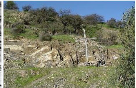
(Fig. 1) AÑO 2006

En segundo término, están las dificultades de acceso al área (6.2 Has.) declarada como sitio de memoria y que se encuentra emplazada al interior de un predio agrícola particular. Sólo en el año 2005 y por iniciativa de familiares, así como también por la entonces Comisión Pro Memorial Lonquén, el fisco pudo comprar el terreno y garantizar una servidumbre de paso, aunque en la práctica, esto se haya traducido en un acceso restringido y esporádico, debiendo solicitar la apertura del portón de ingreso al predio con anticipación. Actualmente se encuentran bien encaminadas las gestiones destinadas a lograr el compromiso de los organismos del Estado (Bienes Nacionales, Obras Públicas. y otros) para regularizar un acceso independiente y el respectivo cerco del camino interior.