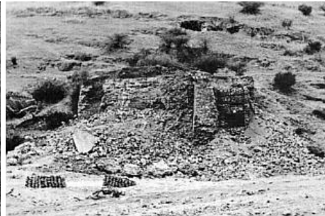
(Fig. 1) AÑO 1980